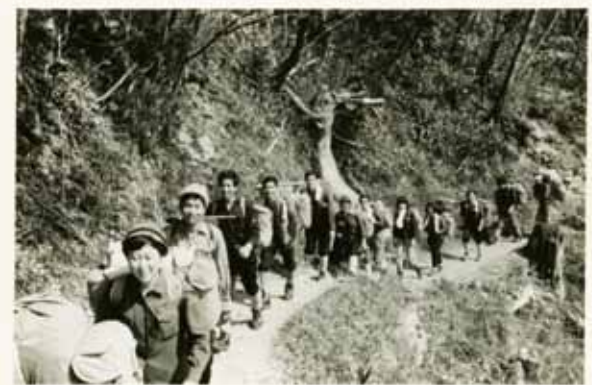
現役時代昭和44年4月新人歓迎「天城山」のひとこま 歓迎山行なので皆さんの顔に余裕があります。

最後になりましたが、今回母校の校友会に支会としての位置を与えられ、所属団体として校友会への参加を求められることになりましたが、改めて校友としての意識を高め、応分の協力を