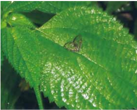
透け翅羽衣蝶(スケバハゴロモチョウ)

平成20(2008)年6月、小仏峠、裏高尾日影沢沿いの登山道を初めて巡回して、青ミズ草(イラクサ科)の葉に黒い縁取りの「ふわふわとしたもの」が無い降りるのを目にしました。同行の「東京都サポートレンジャー会」会長からそれは「透け翅羽衣蝶(スケバハゴロモチョウ)」であると教わりました。「体長10mm前後、黒い縁取りがあり、中は透き通るような翅でとても美しい」その姿に感動し、自分が選んだこれからのサポートレンジャー活動への励ましを受け