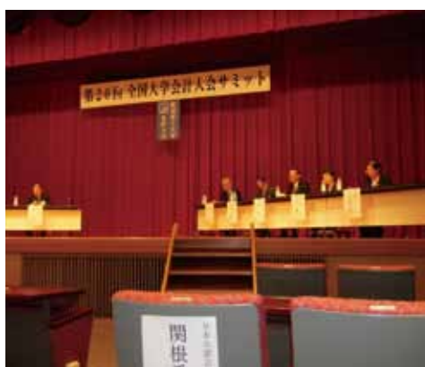
パネルディスカッション